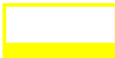
محل درج شناسه ها روی طرح جعبه (Artwork) یا طرح برچسب در صورت استفاده از برچسب